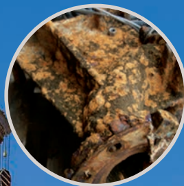
CORROSIÓN POR QUÍMICOS