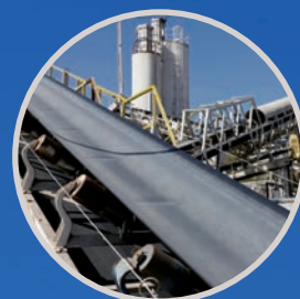
CORTES Y RANURAS